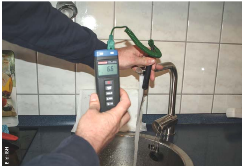
Die Startbedingung, also die Temperatur des Kaltwassers wird gecheckt

Beim späteren Festlegen der Heißtemperatur des Wassers erfasse ich diese ebenfalls erst nach dem Erreichen eines sogenannten Beharrungszustandes. Auch in diesem Fall will ich ja nicht eine Tempera-